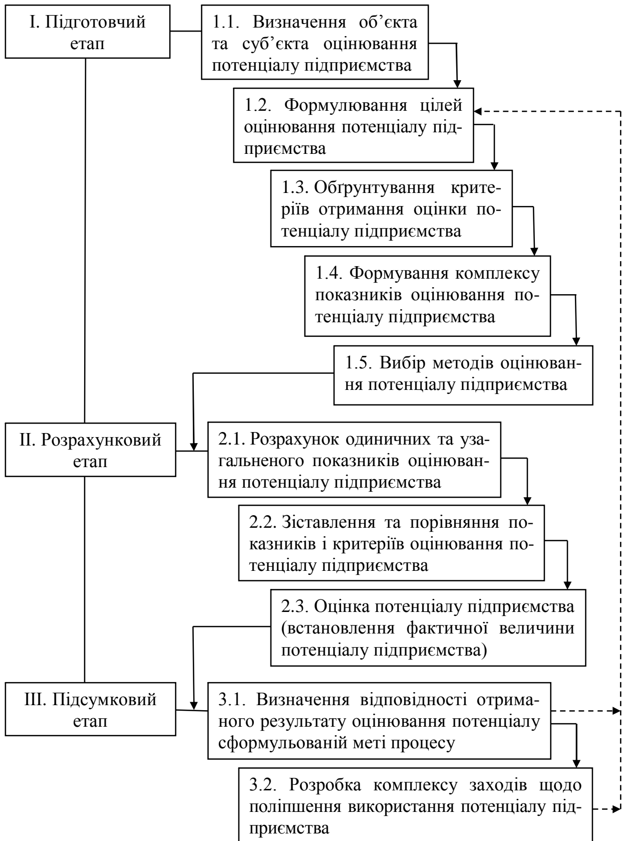
Рис. 1. Етапи оцінювання потенціалу підприємства