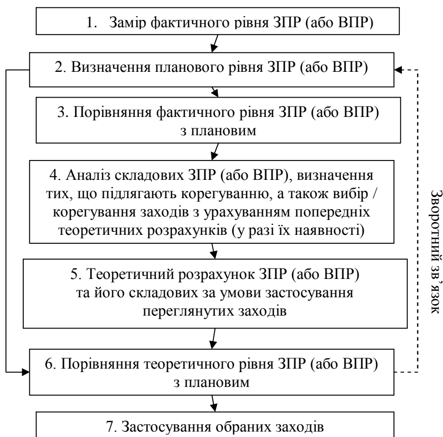
Рис. 3. Процес контролю маркетингу персоналу

Для того, щоб досягти реалізацію завдань, поставлених перед функцією контролю маркетингу персоналу, пропонується використати розроблений процес контролю маркетингу персоналу (рис. 3).